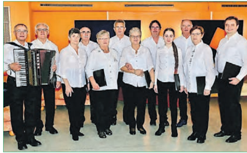
Der eigens für die Bewerbung formierte Sängerkreis trat zum ersten Mal am 17. Dezember 2022 bei der Weihnachtsfeier des Kreisverbands Fürstenfeldbruck-Dachau-Starnberg auf.

Der Bayerische Landesvorsitzende Harald Schlapansky und der Bundesvorsitzende Peter-Dietmar Leber ließen sich von dieser Idee sofort begeistern und nach einiger Überlegung fiel die Wahl eines praktischen Beispiels schließlich auf das Neu-