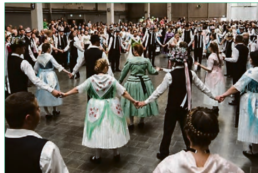
Auch die Messehallen werden wieder reichlich gefüllt

Wir freuen uns auf zahlreiches Kommen und gemeinsames Feiern des nächsten Jahrzehnts.