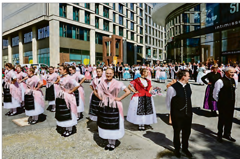
Tanzen in der Ulmer Innenstadt

Nach einer feierlichen Kranzniederlegung klingt der Abend für die angemeldeten Teilnehmer im Edwin-Scharff-Haus mit der Band „Banater Beat“ aus. Gefördert wird dieser