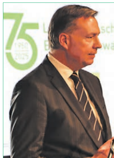
Stephan Mayer, MdB

Mit herzlichen Grüßen Stephan Mayer, MdB