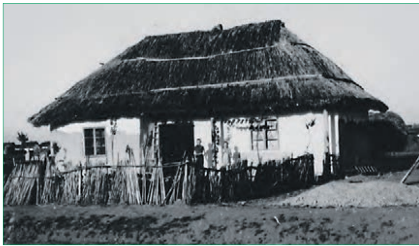
Das Haus der aus Großscham deportierten Familie Christmann in Fundata.

In kompakter Form, auf zwölf Roll-ups, erinnert die Ausstellung in Wort und Bild mit kurzen Erläuterungen sowie Zitaten aus Erlebnisberichten und Briefen von Betroffenen, vor allem aber mit aussagestarken Fotos an die Leidensgeschichte und die traumatischen Erfahrungen der Deportierten, die unverschuldet Opfer eines menschenverachtenden Regimes wurden.