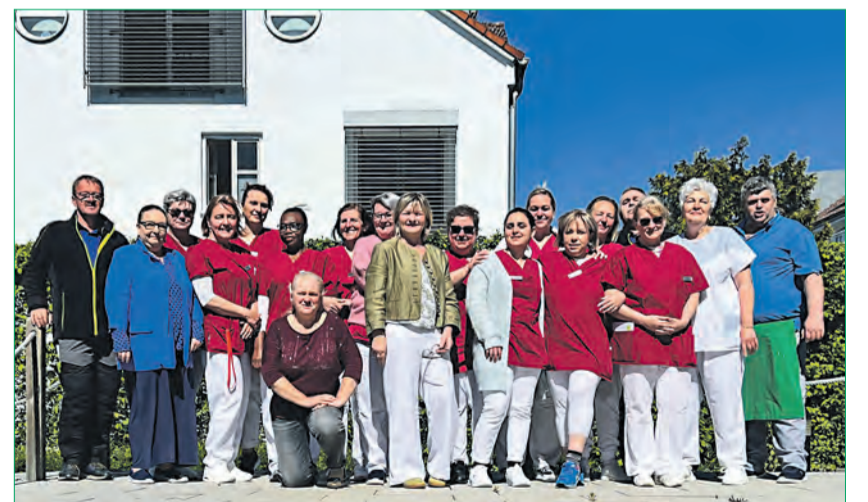
Das freundliche Team des Seniorenzentrums Josef Nischbach aus Ingolstadt ist immer für seine Bewohner da.