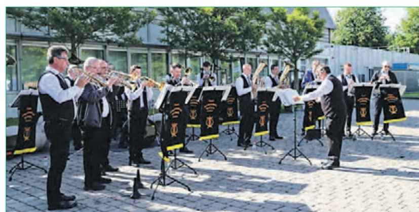
Die Original Donauschwäbische Blaskapelle Reutlingen vor der Donauhalle beim Heimattag in Ulm 2024.

Zum Heimattag werden die Musiker die Gäste am Sonntagmorgen vor der Donauhalle mit einem musikalischen Strauß begrüßen, danach den Gottesdienst musikalisch mitgestalten. Vor dem Abendprogramm mit der Tanzband „Akustik3“ spielt die Original Donauschwäbische Blaskapelle Reutlingen noch beliebte Stücke aus ihrem Repertoire.