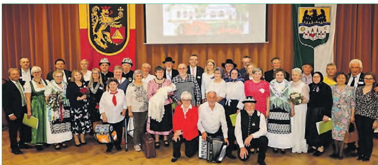
Die lustigen Schwaben bei ihrem Auftritt während der Tagung in Frankenthal 2025.